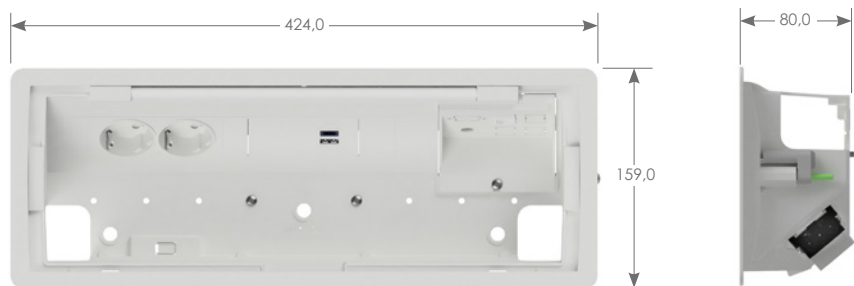
Darstellung ohne Deckel